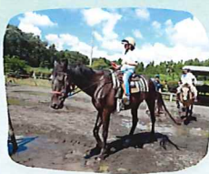
馬場の中で馬を操る練習中