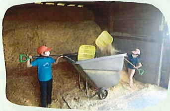
馬小屋の中にしく「おがくず」を運ぶ