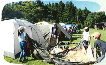
テントをたててテントに泊る